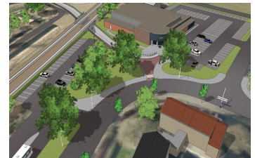
foto ons inspireren? Laat het ons voor 1 maart weten via fijnopzuid@hotmail.nl

en een naam voor de tunnel? Of wilt u via een afbeelding of